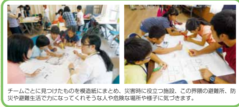
チームごとに見つけたものを模造紙にまとめ、災害時に役立つ施設、この界隈の避難所、防災や避難生活で力になってくれそうな人や危険な場所や様子に気づきます。