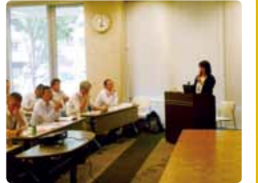
第3回集団指導者研修会（9月9日開催の様子） 15名が修了証が授与されました。 子ども会の活動を伝え、地域に応援団をつくらう!