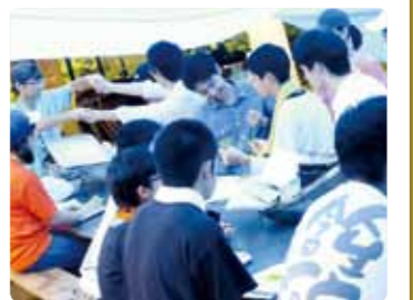
仲間と一緒に考えよう たゆめ研鑽、楽しい活動