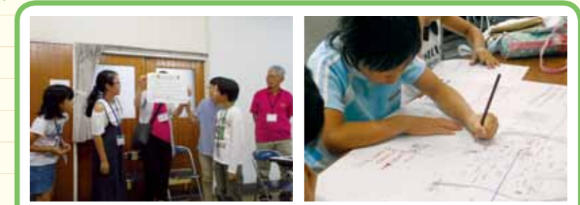
体験をふりかえり、そこでの気づきから、これから実行しようと思うことをみんなでわかちあいます。