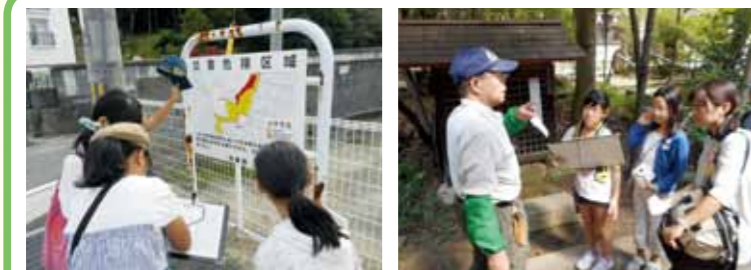
大丈夫窓シートと、この界隈の地図を持って、チームで50分程まちを探検し、まちに災害が起こっても大丈夫か、危険なところはないか探します。