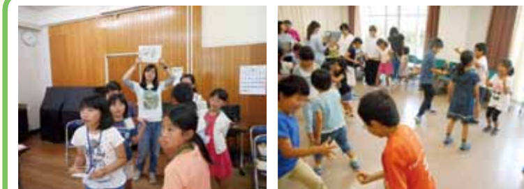
ゲームを通して今日1日、一緒に活動をする仲間と自己紹介の後、まちあるきのためのチームに分かれ、チームの名刺をつくります。