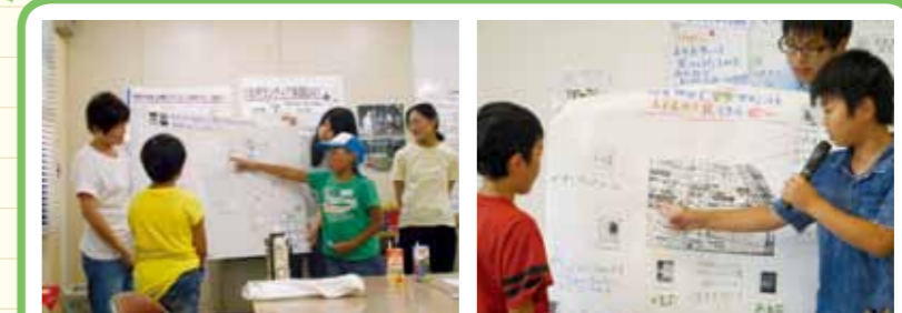
チームごとに見つけたものを全体で紹介しあって共有し、さらに気づきを深めます。