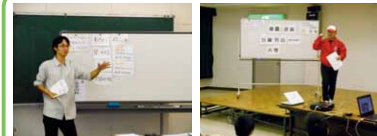
阪神大震災や台風による土砂災害など、災害時のまちの様子をスライドで紹介。さらに語り部のお話を聞いて、防災まちあるきに向けての意識を高めたあと、活動の「ねらい」「スケジュール」「心がまえ」等について説明し、活動の流れについての理解を図ります。